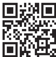
ویژه‌نامه شماره اول