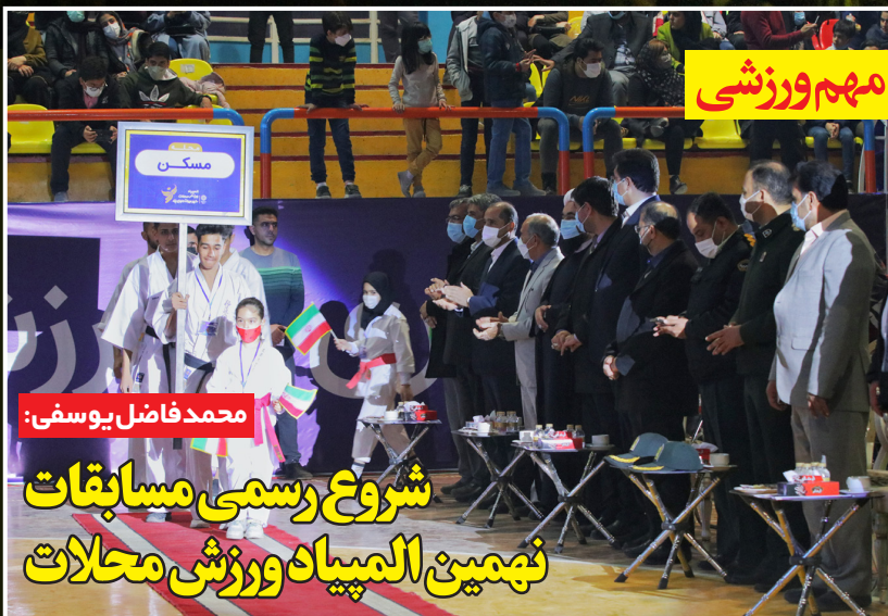
چند اطلاعیه مهم ورزشی

نوید این را می دهیم که یزد در بین کلانشهرهای ایران برای برگزاری المپیاد الگوشده است