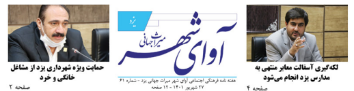
لکه گیری آسفالت معابر منتهی به مدارس یزد انجام می‌شود هفته نامه فرهنگی اجتماعی آوای شهر میراث جهانی یزد - شماره ۶۱ - شهریور ۱۴۰۱ - صفحه ۲ حمایت ویژه شهرداری یزد از مشاغل خانگی و خرد صفحه ۲