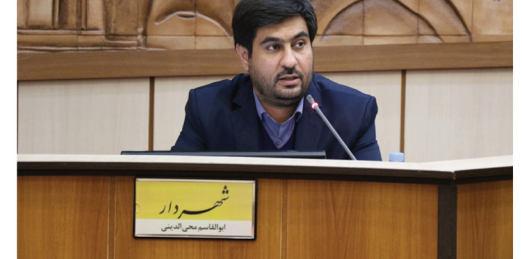
هفته نامه آوای شهر میراث جهانی یزد - شماره ۵۵ - ۱۵ مرداد ۱۴۰۱ - صفحه ۲