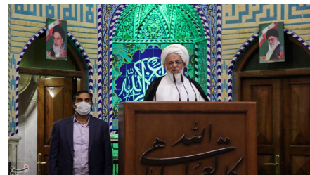
همه باید برای مهار سیل اقدام کنند

هفته نامه فرهنگی اجتماعی آوازی شهر میراث جهانی یزد - شماره ۵۴ ۸ مرداد ۱۴۰۱ - ۱۲ صفحه