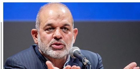
بسیج تمام امکانات برای کمک به یزد