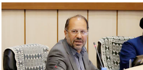
امدادرسانی از استان‌های همجوار