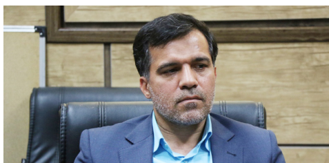
تخلیه فوری بافت تاریخی یزد

رئیس سازمان آتش‌نشانی و خدمات ایمنی شهرداری یزد گفت: در پی بارش‌های شدید و سیل آسای در شهر یزد و فرسوده بودن بافت تاریخی یزد لازم است هرچه سریعتر اهالی منطقه منازل خود را تخلیه کنند و در محل‌های امن مستقر شوند.