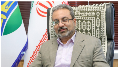
آغاز طرح نوسازی سرپناه ایستگاه های انوبوسی محدوده بافت تاریخی یزد صفحه ۷