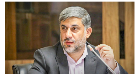
پیگیری سالانه ۴۰ پرونده ثبت آثار ناملموس در یزد صفحه ۳

هفته نامه فرهنگی اجتماعی آوای شهر میراث جهانی یزد - شماره ۵۳ ۱ مرداد ۱۴۰۱ - ۱۲ صفحه