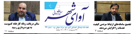
تعمیر سامانه های ارتباط مردمی کیفت خدمات را افزایش می دهد هفته نامه فرهنگی اجتماعی آوای شهر میراث جهانی یزد - شماره ۴۴ - اردیبهشت ۱۴۰۱ - صفحه ۱۱ سان دریافت زبانه کارخانه کبوتر به بهره برداری رسید صفحه ۱۱