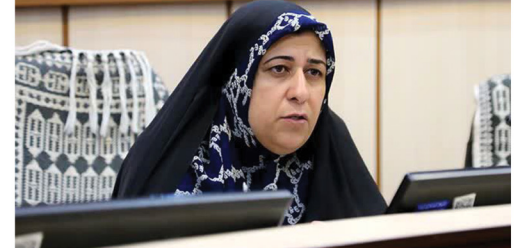
بیشترین اعتبار شهرداری یزد به منطقه بافت تاریخی اختصاص دارد صفحه ۱۰