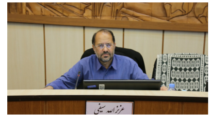
انتقاد سیفی از کاهش ظرفیت قطارهای مسافری یزد صفحه ۶

هفته نامه فرهنگی اجتماعی آوای شهر میراث جهانی یزد - شماره ۴۰ چهارم اردیبهشت ۱۴۰۱ - ۱۲ صفحه