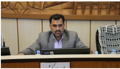
همت شورای ششم شهر یزد در اجرای پروژه‌های عمرانی با قوت ادامه دارد صفحه ۷