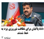
۱۲ صفحه ۷