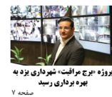
بروزه طرح مرابض، شهرداری یزد به بهره برداری رسید