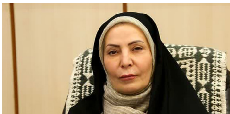
ضرورت نظارت جدی شهرداری بر اعمال تخفیفات و معافی‌ها برای معلولان