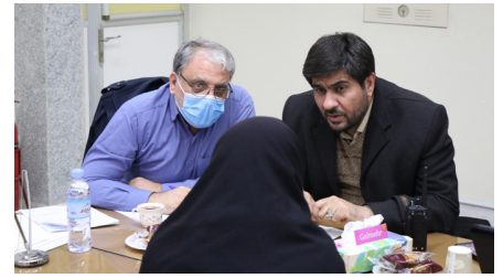
برگزاری دومین روز میز ارتباطات مردمی وزارت کشور در شهرداری یزد صفحه ۲

هفته نامه فرهنگی اجتماعی آوای شهر میراث جهانی یزد - شماره ۷۹ یکم بهمن ۱۴۰۱ - ۱۲ صفحه