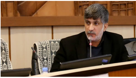
حمایت یزدی‌ها از ولایت و جمهوری اسلامی با استقبال از رئیس‌جمهور صفحه ۹