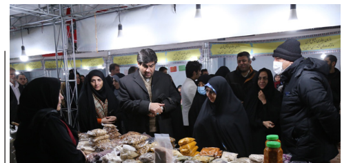
بازدید معاون رئیس‌جمهور در امور زنان و خانواده از بازارچه خدمت شهرداری یزد