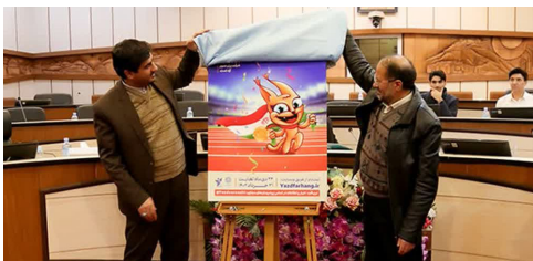
رونمایی از پوستر دهمین المپیاد ورزش محلات یزد در صحن علنی شورا