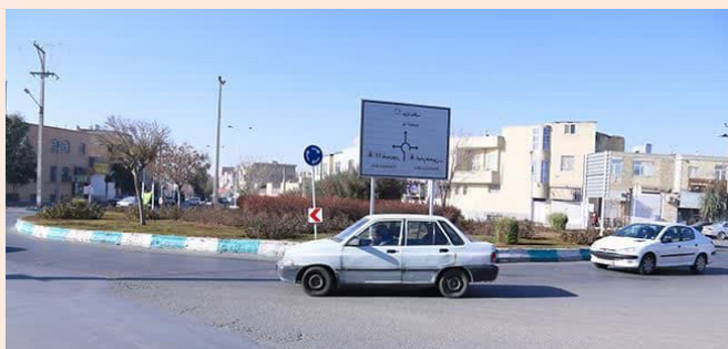
زرین و پرافتخاری در تاریخ اسلام به ثبت رسانده است.

با مصوبه شورای اسلامی شهر یزد و با اکثریت آراء، میدان آرمان واقع در بلوار رسالت یزد به نام شهید امنیت، شهید آرمان علی وردی نامگذاری شد.