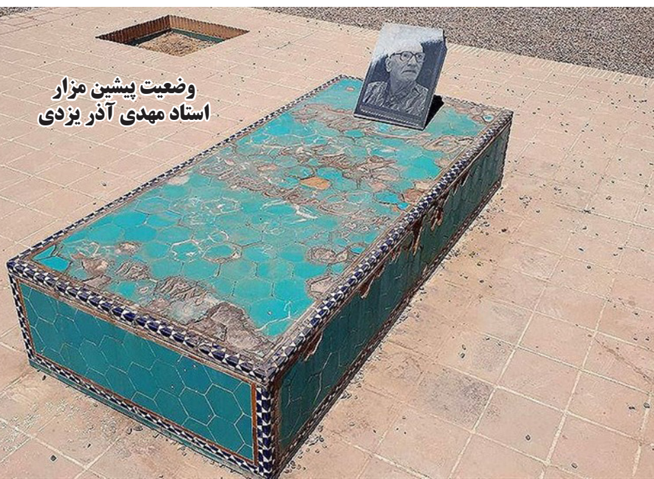
وضعیت پیشین مزار استاد مهدی آذر یزدی

ابوالقاسم محی‌الدینی با اشاره به اینکه برای ساماندهی مزار این استاد ادبیات کودک و نوجوان ایران در سال ۹۶ از سوی شهرداری یزد اقداماتی صورت گرفت، اما به دلیل وجود اختلافاتی متوقف شد، گفت: با پیگیری‌های شهرداری و وساطت استاندار و برخی از مدیران مربوطه، اختلافات برطرف شد و شهرداری یزد از ۴ ماه گذشته عملیات بهسازی کامل این مجموعه و ساخت مقبره استاد مهدی آذریزدی را آغاز کرد. وی با اشاره به اینکه برای ساماندهی این مجموعه و ساخت مقبره استاد مهدی آذر یزدی بالغ بر ۸ میلیارد ریال اعتبار در نظر گرفته شده، عنوان کرد: در حال حاضر این مجموعه با پیشرفت بالغ بر ۹۰ درصدی همراه است و در ماه‌های آینده از آن بهره‌برداری صورت می‌گیرد.