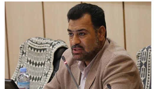
عملکرد سامانه شهروند سپاری زیر ذره بین کمیسیون نظارت ۳ صفحه