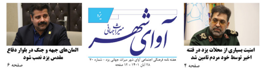
المان‌های چهره و چک در بلوار دفاع مقدس یزد نصب شود صفحه ۶