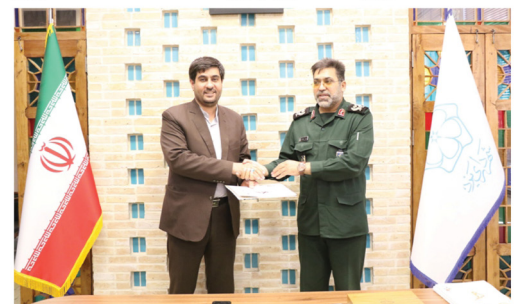
امتیاز بسیاری از محلات یزد در هفته اخیر توسط خود مردم تأمین شد صفحه ۲