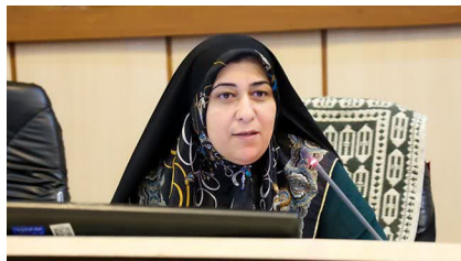
حقییر السادات مطرح کرد: ضرورت حمایت از هتل‌داران شهر یزد صفحه ۹