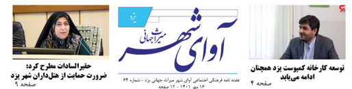
نوسه کار خانه کبیرت یزد هجنان ادامه می‌یابد