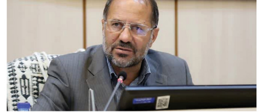
نامانی‌های اخیر توسط سرویس‌های بیگانه هدایت می‌شود