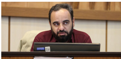
گذر فرهنگی مذهبی در یزد ایجاد می‌شود