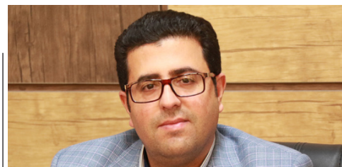
بودجه آسفالت معابر یزد ۴۰ درصد افزایش یافت