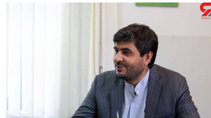
توسعه کارخانه کمپوست یزد همچنان ادامه می‌یابد صفحه ۴

هفته نامه فرهنگی اجتماعی آوای شهر میراث جهانی یزد - شماره ۶۴ ۱۶ مهر ۱۴۰۱ - ۱۲ صفحه