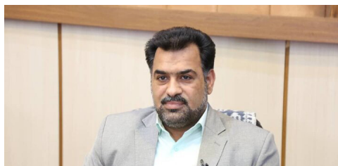
ضرورت دسترسی مناسب و استفاده عموم مردم از آموزش‌های شهروندی