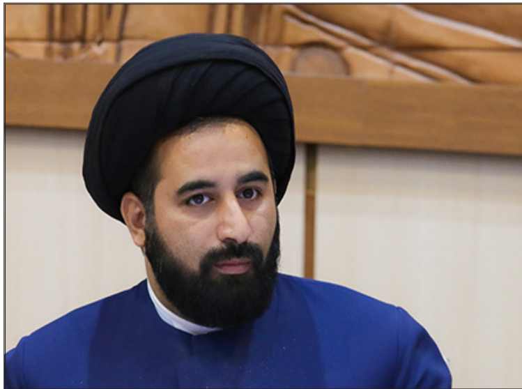
نائب رئیس شورای اسلامی شهر یزد خبر داد: